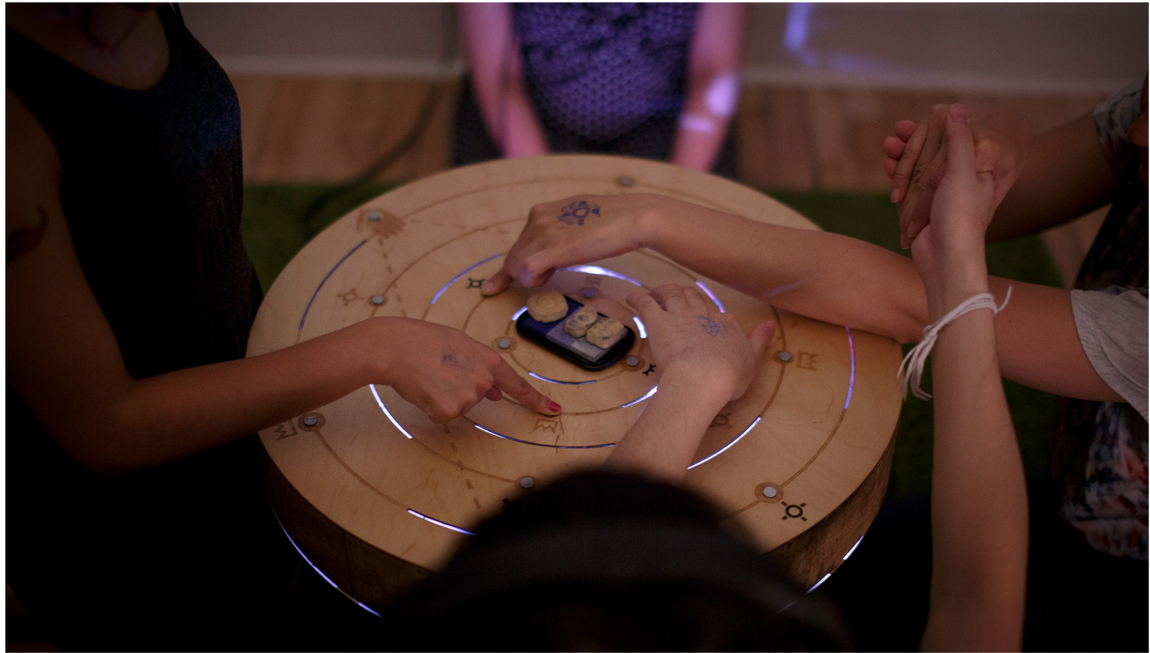
Team Sagittarius, We Are Fine, We'll Be Fine , 2015, Jeu interactif. Team Sagittarius, We Are Fine, We'll Be Fine , 2015, Interactive Game.

Ethnocultural Art Histories Research (EARH) présente | presents